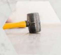
Martillo de goma