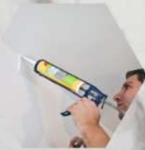
Adhesivo: sellador poliuretánico Presentación: cartucho por 300 ml (Rendimiento: 1,5 m 2 )